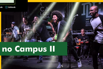
Grupo Zueira no Campus II