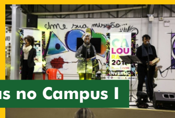
50 Tons de Pretas no Campus I