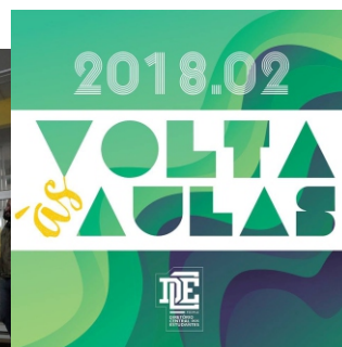
Debate entre alunos e Reitoria na Volta às Aulas do segundo semestre de 2018